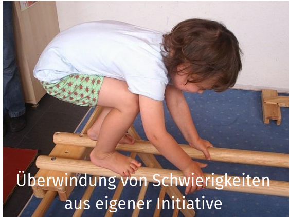
Überwindung von Schwierigkeiten aus eigener Initiative