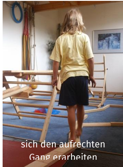
sich den aufrechten Gang erarbeiten