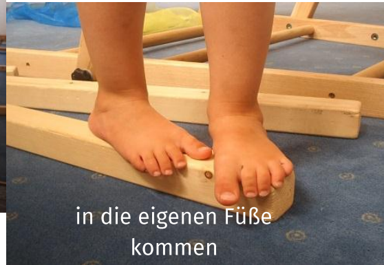
in die eigenen Füße kommen